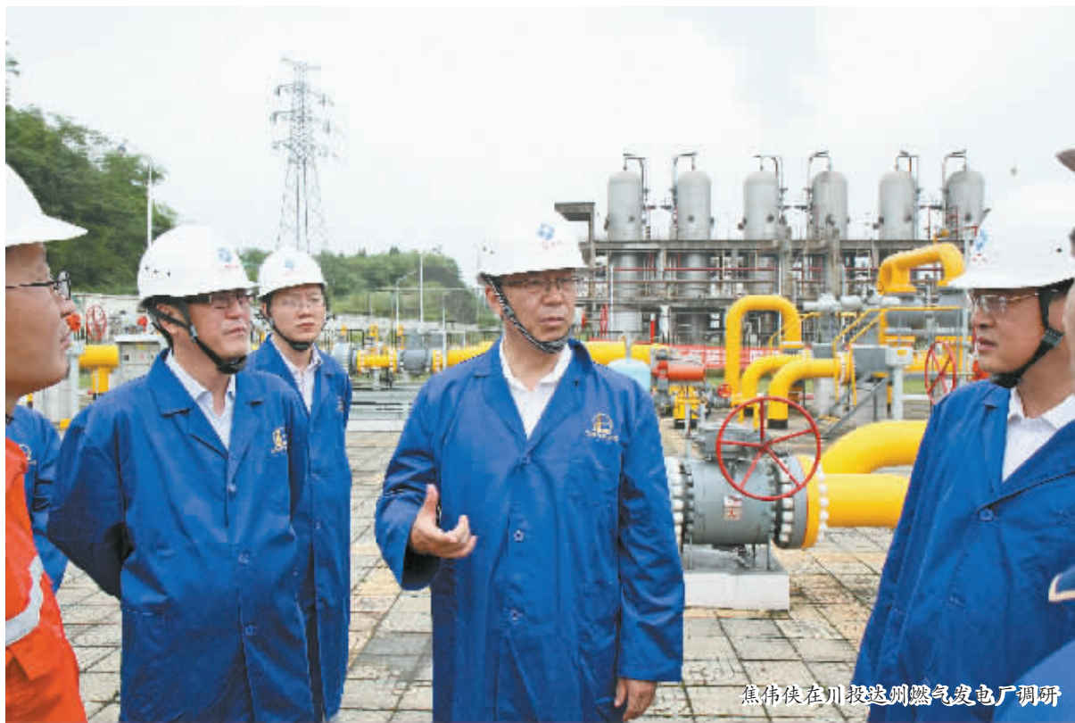
焦伟侠在川投达州燃气发电厂调研

本报讯 6月16日,川投达州燃气发电厂一期工程2号机组已投入运行约一周时间,企业在生产经营过程中还存在哪些困难,党委政府能够提供什么样的服务?带着这些问题,市委书记焦伟侠深入中石化川气东送管道工程达州化末站和川投达州燃气发电