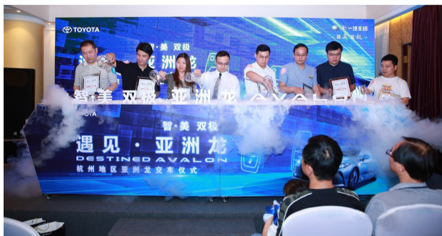
一汽丰田亚洲龙百台交车仪式

亚洲龙是一汽丰田旗下的旗舰轿车,在TNGA全新造车哲学之下,亚洲龙凭借大胆、突破、不妥协的精神,让用户的体验感加倍提升。新车以“双极Premium”的研发理念,将诸多不可能进行的创意融合,为用户带来极致体验。如座椅配备了触感细腻的真皮打孔皮质、更低更薄的仪表台带来宽阔的