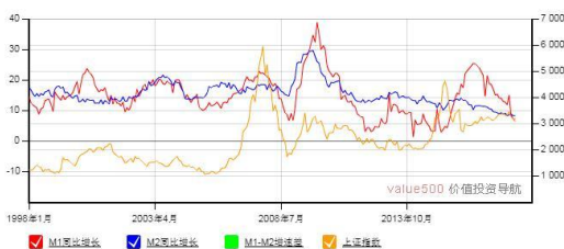
M1-M2 增速差与上证综合指数走势图

4. 大气污染 | 习近平在全国生态环境保护大会上强调，要把解决突出生态环境问题作为民生优先领域，坚决打赢蓝天保卫战是重中之重，同时李克强指出，突出加强工业、燃煤、机动车“三大污染源”治理，加快发展节能环保产业，提高能源清洁化利用水平。加速淘汰低排放标准汽车、积极推动排放标准升级、发展清洁能源或是主要思路和方向。