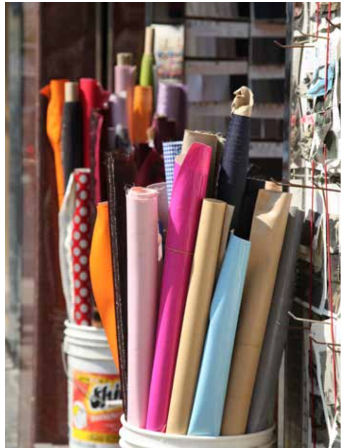
卷轴尾端布料是成衣制造工厂的盈余纺织品。