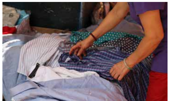
废弃成衣是指尚未被穿着或未经出售的成衣。