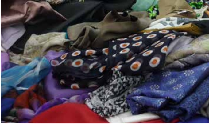
样品废料是工厂制造样品所剩下的纺织品。