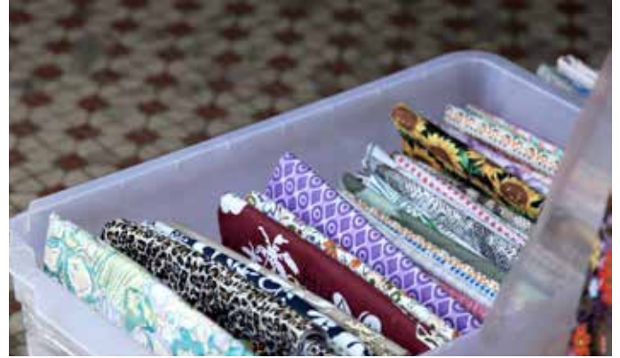
已损坏的纺织品是例如有颜色或印制缺陷的纺织品。