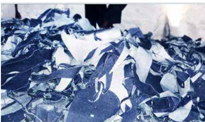
布料碎屑是指切割和缝制成衣过程中所剩余的纺织碎布。