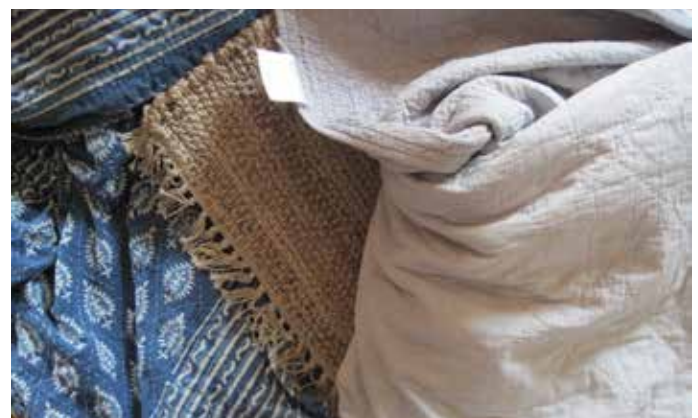
二手纺织品是指任何消费者使用过或丢弃的纺织品，不包括衣物或饰品