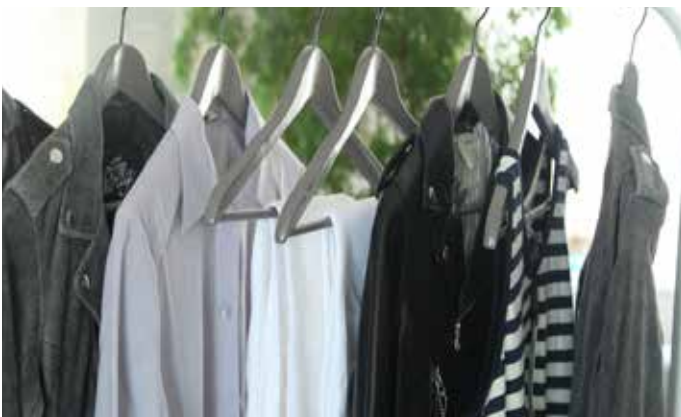
服装样品是服装设计和生产过程中的样品。