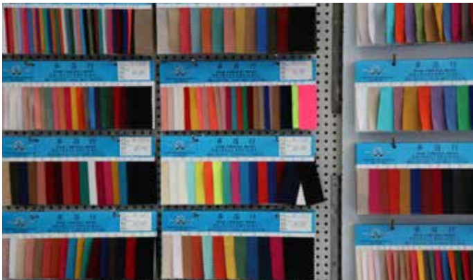
纺织色板是剩余的纺织色板样品。