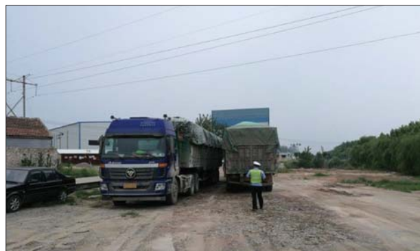
民警查处的严重超载大货车。

目前,大队已将车辆扣至汇通停车场,下一步大队将按照法律规定予以严格处罚,并坚决落实“一超四罚”相关措施。