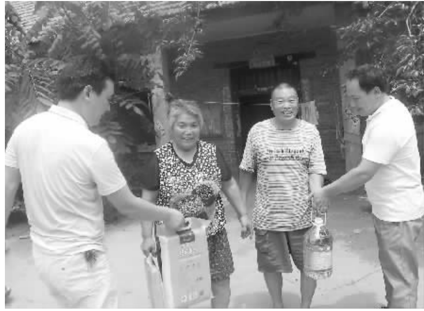
昨日，扶沟县练寺镇民政工作人员联合镇负责人，带着慰问品对老复员军人、烈属、参战参试人员、现役军人家属进行走访慰问并带去了节日的祝福。图为镇民政所工作人员到杨王村退伍军人家中慰问。

“烟站要是能扩大收购烟量就好了，好扩大种植面积带动群众种烟。乡党委、政府常说，一人富不算富，全村都富才算村干部有真本事。俺是真心想做这个有真本事的人。”豆支书的话坚定自信、掷地有声。