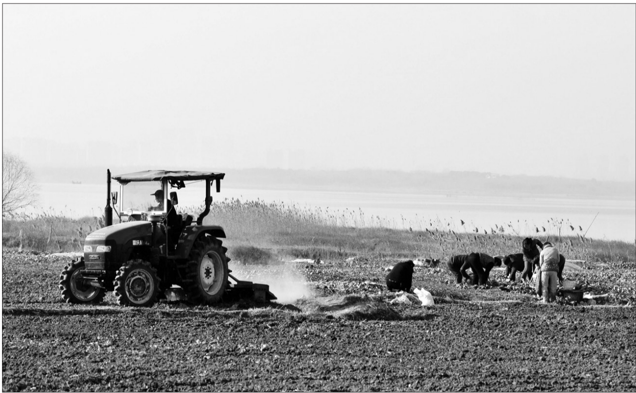
安徽省合肥市庐阳区大杨镇草塘社区近日对辖区董铺水库岸边近 100 亩的菜地进行了铲除。庐阳区大杨镇对辖区董铺水库,大房郢水库一、二级保护区范围内的种植业、养殖业等严重污染源共计 115 家进行全面清理或关停。

据悉,截至目前,自治区环保厅的行政审批事项、“三非”治理、文件简报、会员卡专项清理等治理工作已基本完成,其中已调整下发了包括建设项目环境影响登记表和环境影响报告审批在内的 6 项行政许可事项。