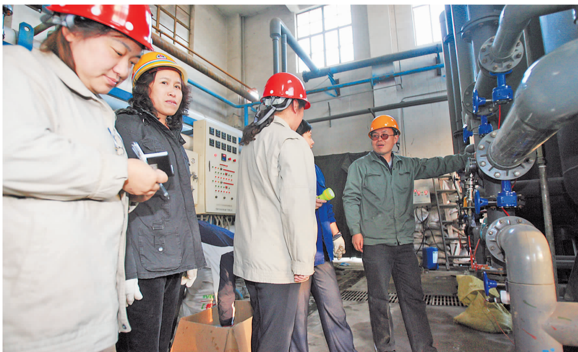
供暖即将开始,小鸭热电厂的技术人员正在培训新员工。