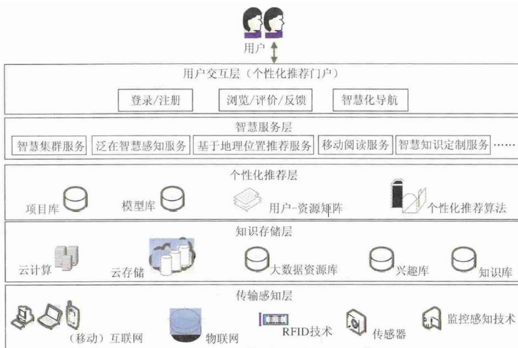
图3 基于智慧知识服务的智慧图书馆个性化推荐服务体系

来源：曾子明,金鹏. 智慧图书馆个性化推荐服务体系及模式研究[J].图书馆杂志,2015(12), 16-22