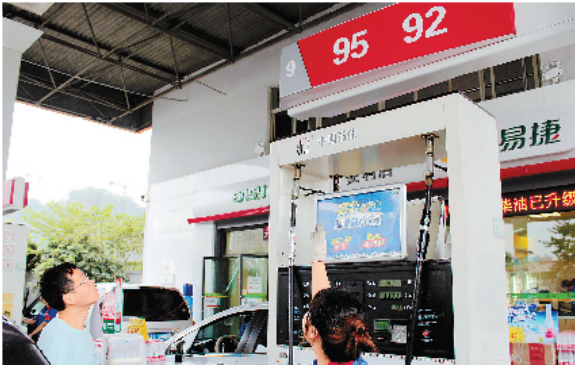
加油站工作人员正向司机介绍新标号汽油。

此外,国V汽油还降低了锰含量、烯烃含量的指标限值,降低了油品中不良组分含量;提高了冬季蒸汽压下限和夏季蒸汽压上限,改善了使用性能。汽油和柴油的质量升