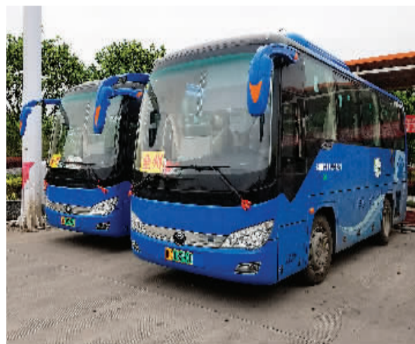
新能源县际班车正在充电。

同样的问题也出现在骏达公司，苏先生表示，目前汽车客运北站小麻雀物流基地和桂林汽车客运南站有充电桩，但数量不多。永福的新能源车停在琴潭客运站，但只有小型充电桩，充满要十几个小时。“建设充电桩需要场地和资金，比如小麻雀的充电桩就花费了200多万，很多企业是负担不了的，我们也希望相关部门在充电设施方面给予更多的支持。”