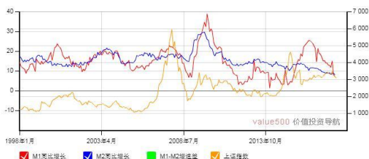
M1-M2 增速差与上证综合指数走势图

4. 机器人 | 10日召开的第五届中国机器人峰会暨智能经济人才峰会上，多款智能应用产品亮相。其中，一款机器人的机械臂重复定位精度能够达到0.03毫米，已经在智能制造企业得到应用。数字工厂智能升级后，生产线效率提升了近3倍。