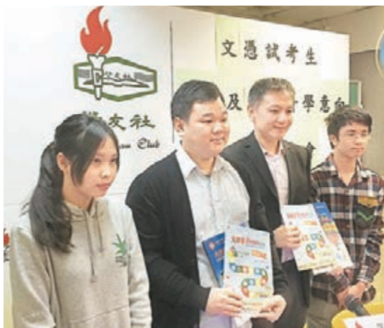
學友社提醒學生選擇升學出路時應先了解課程的學術及專業認受性,掌握多元出路資訊後再作全盤考慮。

香港文匯報訊 (記者 姜嘉軒) 本港資助學士學位有限,港生轉戰內地及台灣升學的情況愈見普遍。學友社調查發現,「收生要求較低」及「學費相對便宜」是到內地及台灣升學的最大賣點。升學專家表示,內地與香港已簽訂備忘錄在高等教育升學上互認學歷,但有意投身特定專業的同學仍需滿足各專業團體的執業資格,學生報讀前須了解回港後在學術上及專業上的銜接。