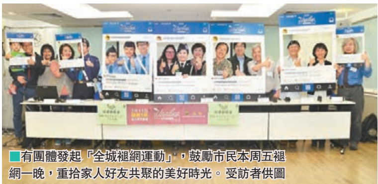
有團體發起「全城褪網運動」,鼓勵市民本周五褪網一晚,重拾家人好友共聚的美好時光。

分家長或以沒收上網裝置、剪電線、拔電掣來處理青少年沉迷上網的問題,但只是治標不治本。事實上,網絡溝通有其優點,但這不能