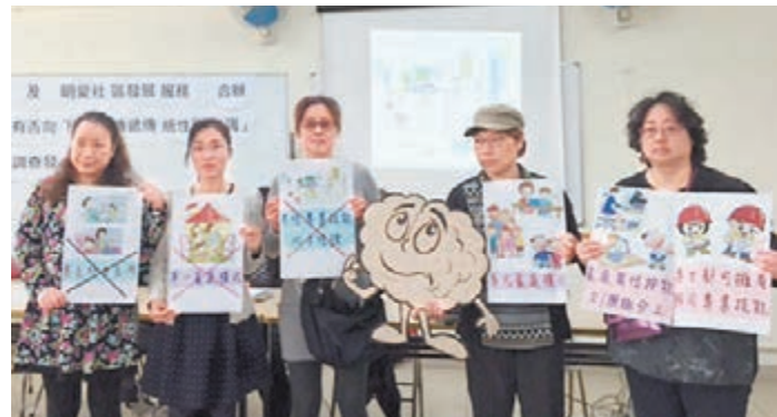
有婦女關注團體透過調查發現小學教科書內容隱含錯誤傳統觀念,擔心下一代被誤導及對婦女構成壓力。

香港文匯報訊 (記者 姜嘉軒) 男主外女主內、男強女弱等先入為主的觀念,往往是社會的偏見。有調查發現,部分小學教科書的插圖出現性別定型的問題,如趕上班的一定是「爸爸」,留家照顧孩子的一定是「媽媽」,父母子女「一家四口吃飯」就是「完整家庭」。有單親媽媽指出,這類內容會令自己及兒子感覺自身的家庭並不完整,團體發言人促請教育局嚴格監管教科書內容,避免出現歧視。