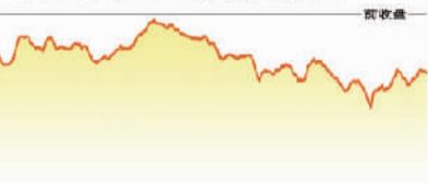
上证综指 深证成指