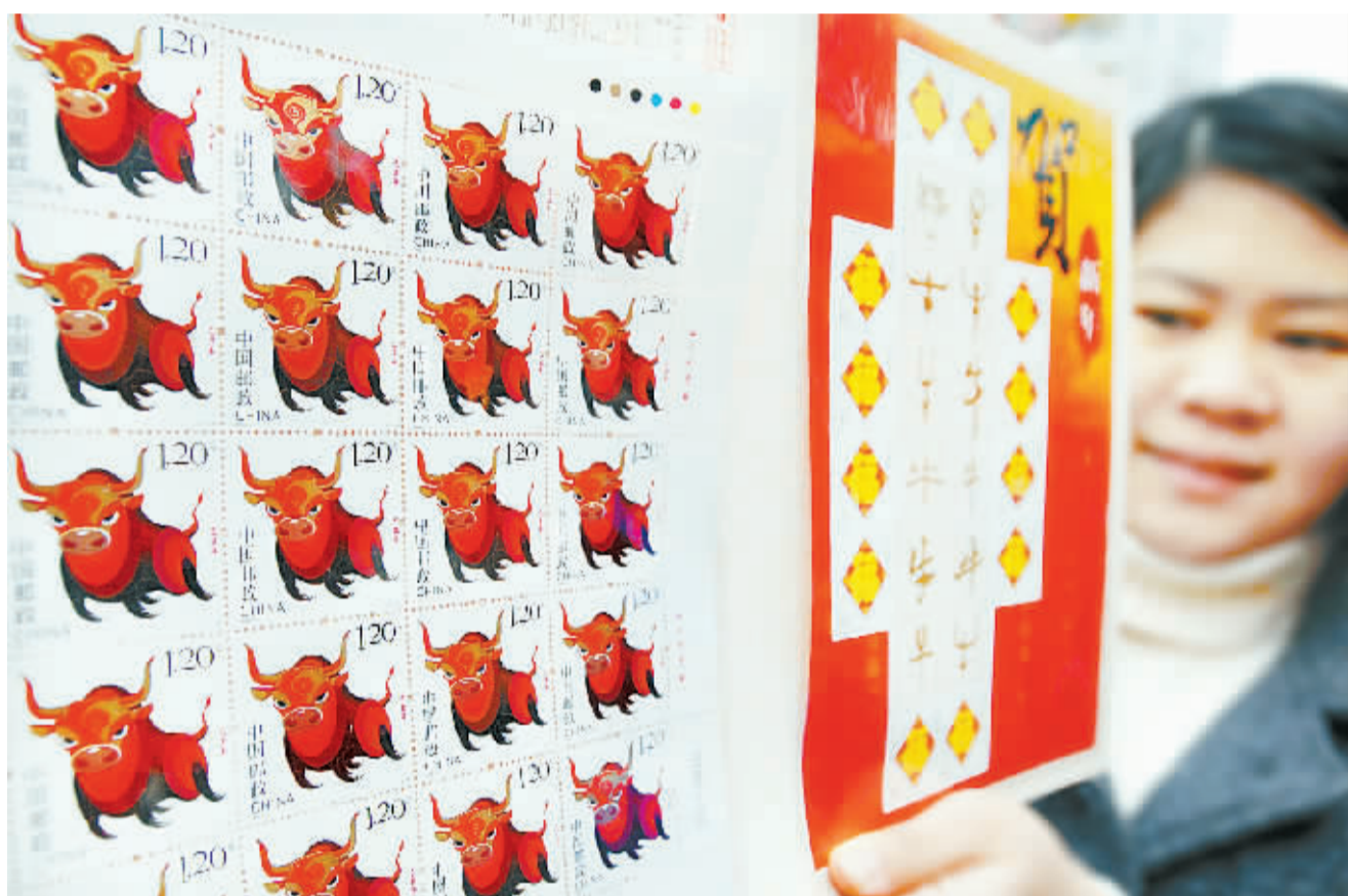
1月5日,2009年牛年生肖(己丑年)特种邮票正式对外发行。邮票图案以红色健壮的奔牛形象,表现出奋力向前的视觉效果,寓意人们对牛年的期望与寄托。