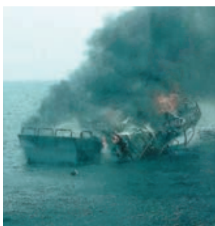
花蓮「花東2號」賞鯨船13日下午在花蓮港外海失火，無人傷亡。

香港文匯報訊 據中央社報道，花蓮「花東2號」賞鯨船昨日下午在花蓮港外海失火，附近賞鯨船接獲求救訊息後立即前往搭救，所幸船上46名人員順利逃生，虛驚一場。