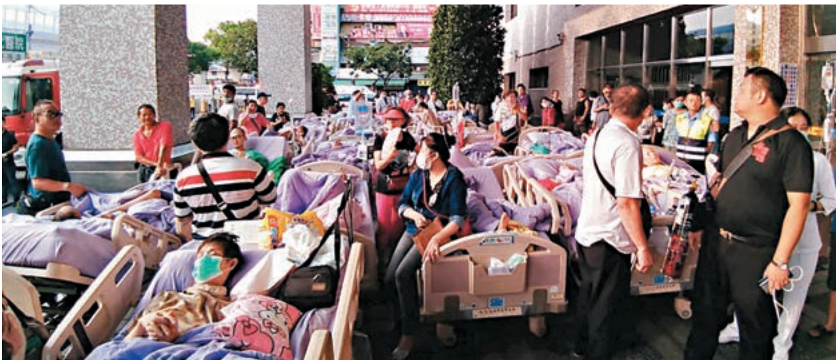
台北醫院13日凌晨，疑似電源線起火造成9死10重傷6輕傷。圖為大量病患被疏散至室外。

台灣身心障礙聯盟秘書長滕西華則說，很多長照機構、護理之家在高樓，面臨不易逃生的狀況，若滅災觀念、硬體設施無法齊備，就算照顧人有三頭六臂也無法因應。