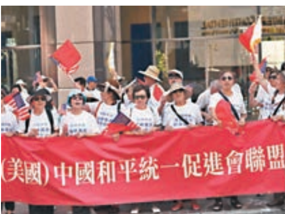
當地時間12日，洛杉磯華裔華人華僑手舉中國美國旗匯聚市中心，抗議蔡英文「過境」美國。

據報道，蔡英文此次在訪問巴拉圭和伯利茲前後「過境」美國，中方已向美方提出嚴正交涉。