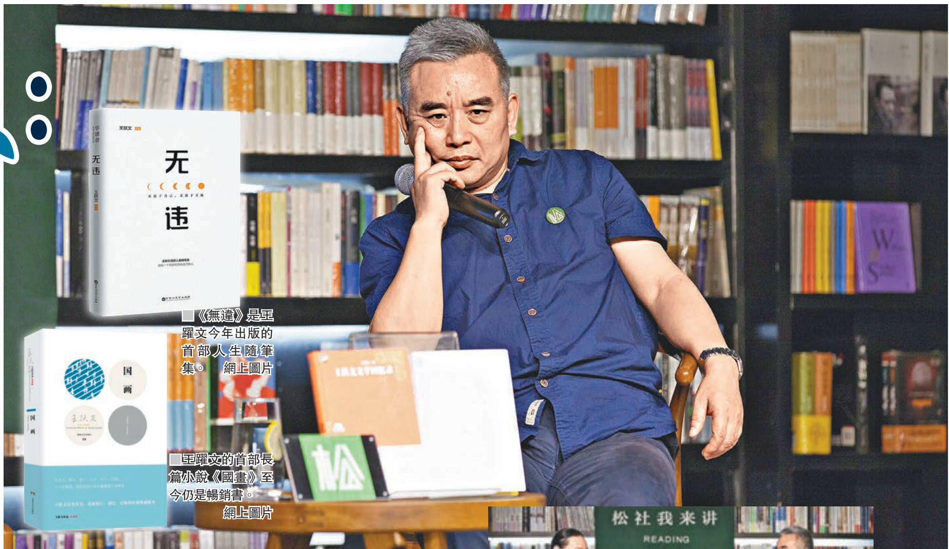
《無違》是王躍文今年出版的首部人生隨筆集。