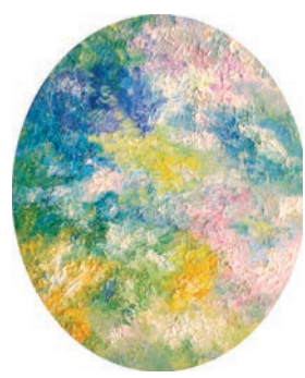
《Starry Peace》, 2016

品的創作概念和技巧等，水禾田老師也有親自示範給我，從他們身上我也學習到了很多。」而未來，她將攜水墨新作和部分北極光作品參展 Asia Contemporary Art Show 及 Fine Art Asia 2017。