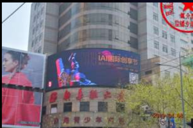
上海淮海中路新华联商厦