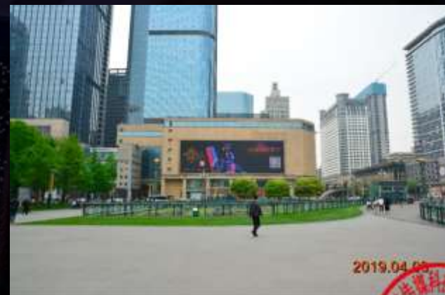
成都天府广场百扬大厦