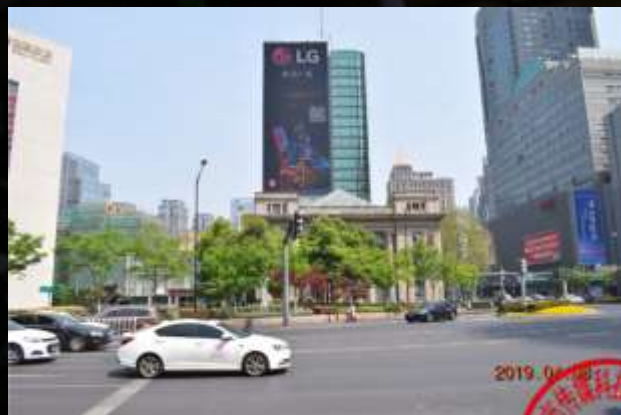
南京新街口天时大厦