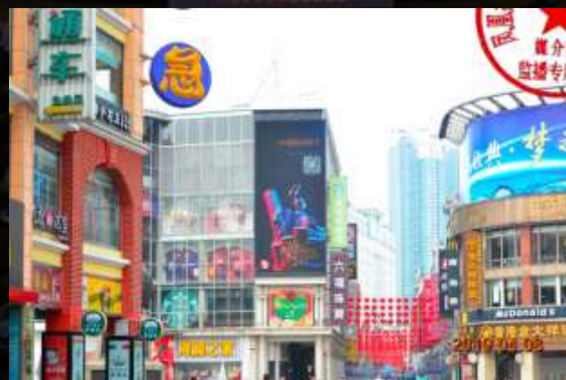
广州上下九赛博广场