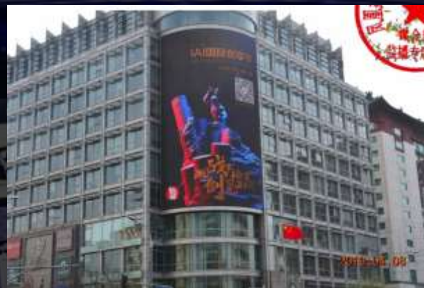
北京金宝街国旅大厦