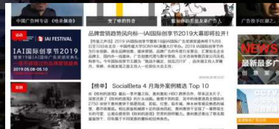
网站首页活动入口