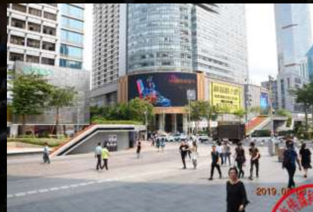
深圳华强北现代之窗屏