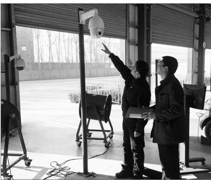
山东省胶州市近日对辖区机动车尾气检测单位相关设施进行升级改造,加强对尾气检测全过程的实时监控,严格杜绝检测过程中的不规范行为,保障数据真实可靠。