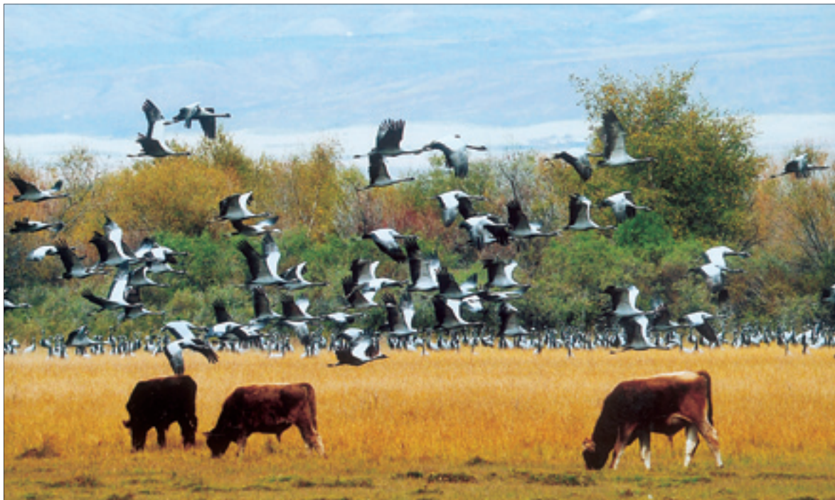
图 12-3 伊犁河谷良好的生态环境吸引了大批迁徙的蓑衣鹤在此栖息和觅食

开展了伊犁河流域水土资源开发、水土流失治理、生态保护关键技术研究及工程示范。研发提出新垦区土地熟化与生产力提升、有机—绿色产品生产加工、特色生物资源开发与保护等水土资源可持续利用技术模式 31 项（套），草地农业系统优化配置与保护技术模式 7 项，水土流失治理与生态安全保障体系建设技术模式 11 套，并结合伊犁河流域资源与区位优势，确定伊犁河流域产业方向和定位，提出了伊犁河流域水土资源开发与管理模式及可持续发展对策。建设不同类型的试验示范区 35 个，面积 23 万亩；开发出具有创新性的水土资源开发利用与生态保护技术，并成功应用于伊犁河流域开发建设中，取得了显著的社会、经济和生态效益。