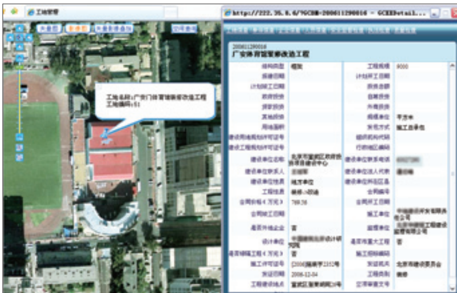
图 12-2 北京城市工程项目数字化监管平台

实施北京城市工程项目数字化监管示范工程。该工程通过研究城市工程项目生命周期各管理环节的业务关系和数据关系,确立了以单体为线索的精细化工程管理模式,建立了以单体为核心的基础数据库。基于基础数据库建立起招标投标、质量监督、安全监督、施工许可和竣工备案各业务环节间的数据关系和业务逻辑,实现了工程项目生命周期中各个阶段数据的互通共享,以及对工程项目全过程、全方位的动态监管,减少了因现有业务管理体制产生的监管交叉或监管缺位现象。