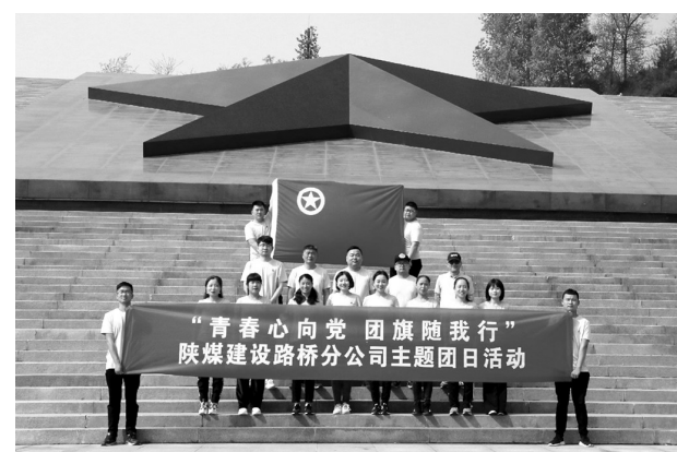
五四青年节前夕,建设集团路桥分公司团委以“青春心向党,国旗随我行”为主题,组织公司全体团员开展了参观革命根据地、绿色环保志愿服务等内容的主题团日活动。

生态水泥每年年初按照培训需求,制定年度培训计划,并认真落实计划,使员工技能与岗位要求相匹配;为提升员工专业知识和操作技能,公司及所属各单位组织开展了“岗位描述大赛”“职工技术比武”、青年员工“传帮带”等活动;所属的陕煤公司以“互联网+培训”的形式,通过OA智能办公系统、微信群向职工推送学习内容,使学习不受时间和地点限制。为深度创建学习型组织,创办了“华山大讲堂”,采用内外师资队伍,以互动教学的形式,使员工做到学以致用、知行合一。为引导员工“爱岗敬业、勤奋自学”,策划开展了“最美生态人”,用身边的典型人物和事迹感染员工,营造了“比、学、赶、超”的积极向上氛围。通过多个平台、多种形式全面提升员工素质,使员工自信地和企业共同前行。(董文琴)