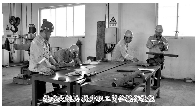
技术大练兵 提升职工岗位操作技能

近年来,生态水泥公司(以下简称“生态水泥”)在快速发展的同时,以满足劳动者对美好生活的向往为目标,深入践行“一切为了发展,一切为了员工”的企业宗旨,在物质和精神层面不断满足员工需求,员工幸福感和获得感持续提升,干事创业热情倍增,凝聚了企业高质量发展的内生动力,实现了企业与员工的共赢。