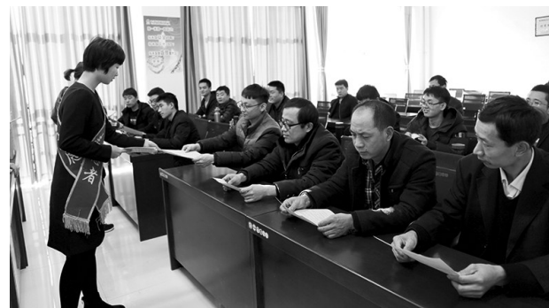
今年4月25日-5月1日是我国第17个《职业病防治法》宣传周。宣传周活动中,榆北煤业曹家滩矿业公司将职业健康知识以“职业病防治文艺演出”的形式搬上舞台,并以微信有奖答题的形式传播于网络,全面提高全员职业防治意识。图为4月30日,该公司抽调专业人员成立联合小组,走进车间、班组,为一线员工讲解职业防治知识。

2018年,陕建机股份公司顺应国家经济政策、产业形势,继续优化产业结构,以提高效益为中心,加强成本管理,提升产品品质,扩大产能产量,同时严格生产经营考核,稳步推进企业发展。具体表现一是公司盈利水平大幅提升,毛利率32.92%,同比增长3.34%;净利率为6.88%,同比增长5.59%;二是资产质量显著改善,销售费用率有所减少,应收账款周转天数、存货周转天数下降。三是经营活动现金流净额3.1亿元,同比增加592%,创历史新高。公司筑路设备及配件销售收入、建筑施工产品租赁收入、筑路施工产品租赁收入、钢结构产品收入等各项经营指标较上年同比大幅增长。(张晋安)