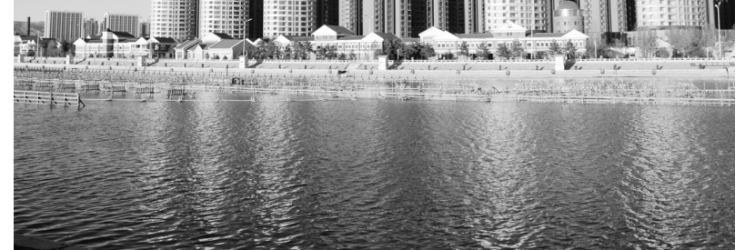
图为蓝天映村下的呼和浩特市东河一景。

同时,玉泉区把以“农家乐”为主要内容的生态旅游作为转变经济发展方式的重要途径,发展民俗文化乡村旅游。实施湿地公园农家乐建设,以政府引导、社会参与、自主经营的模式发展农家乐生态旅游加强旅游基础设施建设,在改善农村生活环境的同时,为农民增收。 张贵荣