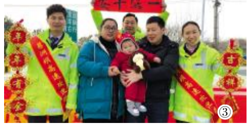
图1易普力新疆公司开展新春送祝福 图2三公司巴基斯坦 DASU 水电站举办新春晚会 图3公路公司大广北高速为旅客送温暖