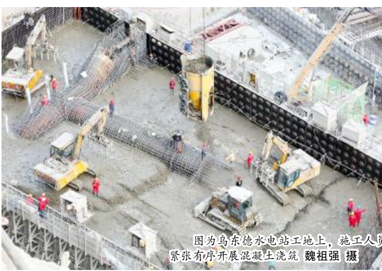
图为乌东德水电站工地上,施工人员紧张有序开展混凝土浇筑。

为此,施工局不断提高现场施工管理水平,强化工点管理责任意识,做到协调到位、落实有力,使现场各环节运转高效,有效执行施工计划。并持续强化精细化施工组织能力,进一步加强混凝土浇筑一条龙管理,通过采取单罐吊运