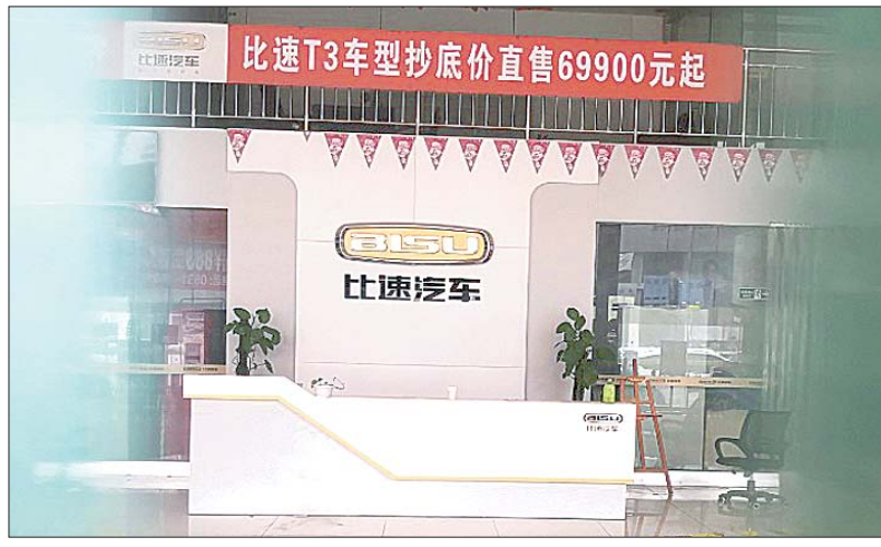
比速汽车4S店大门紧锁,房间内比速汽车几个大字很显眼。

“当时我就问了买车的销售经理,她说4S店关门是因为(比速汽车的)工厂倒闭了。”得知车企倒闭的消息以后,韩先生着实吓了一跳。