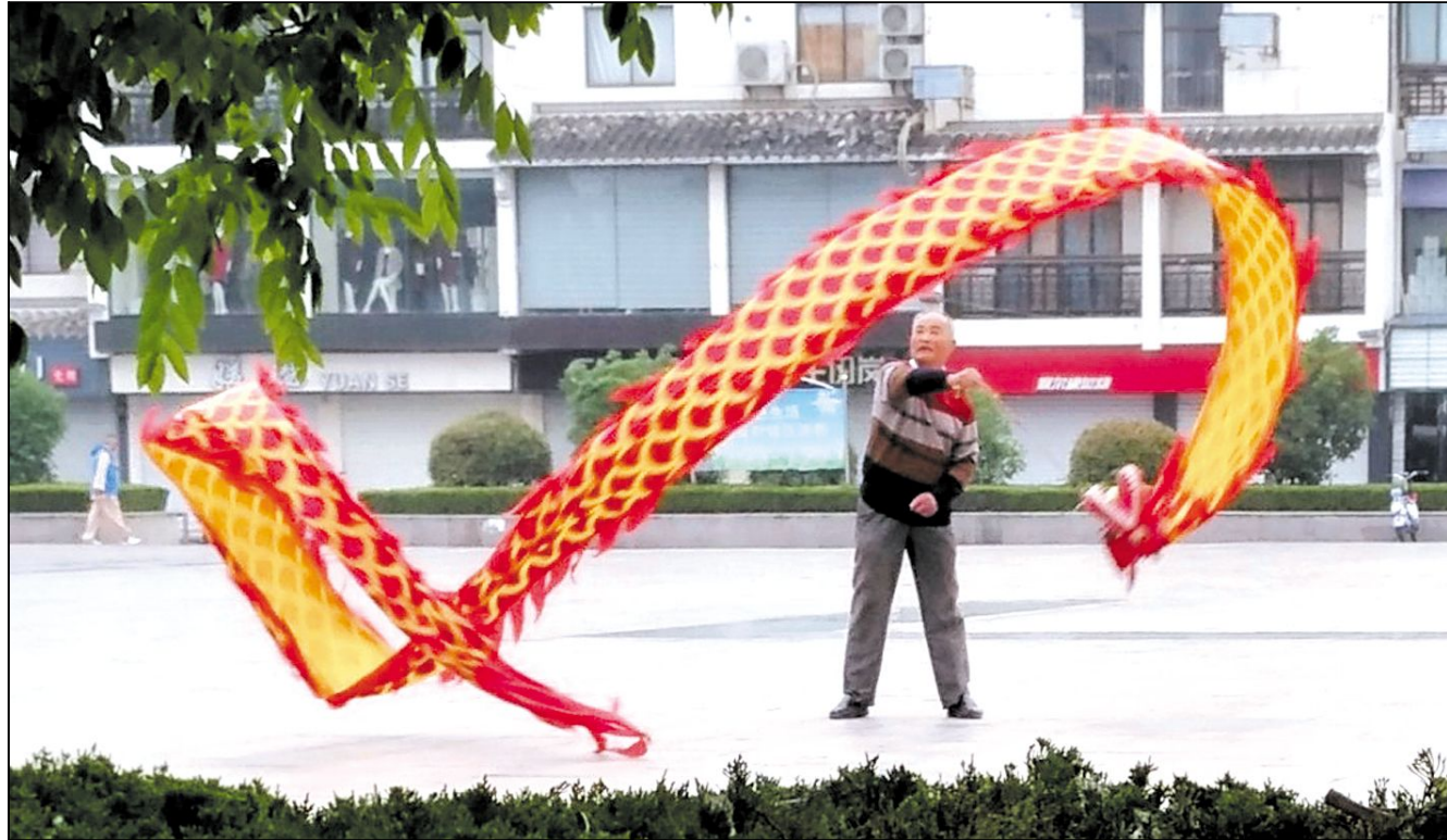
每天清晨,漕运广场总会有许多市民在此锻炼身体。看,这位大爷把“龙”舞得多起劲。

五月是多情的月份,刚过完劳动节转眼又到母亲节了。我和妻子还没商议好是否回娘家,妈妈就把一大袋东西装好给我们,然后说:“这些是花旗参、花胶、鲍鱼干等汤料,你们母亲节时回去的时候记得帮我带给亲家母啊。” 妻子看了我一眼,说:“妈妈,要不今年我们还是留家里陪您吧?我妈有弟弟妹妹她过节呢!” 妈妈说:“我知道你孝顺,但我不过母亲节的。再说了,你是你,你弟弟妹妹是弟弟妹妹,他们代替不了你的啊!你们俩平时也不常回去,你爸爸妈妈肯定想你的。母亲节,是要回去陪母亲才对的!” 妻子还想说什么,妈妈却转过头对我说:“儿子,你岳父岳母把女儿养到这么大,教育得这么懂事,你得好好的孝顺他们啊。逢年过节什么的,你要陪着老婆回去看看他们,好让他们放心啊!” 我和妻子面面相觑,原本我们计划今年母亲节我和妻子分头行动,各自陪各自的妈妈的,但妈妈的这一番话,算是断了我们的这个念头。 我和妻子结婚一年多了,娘家在邻市。因为工作忙,妻子平时很少回娘家,因此,每次回去岳父岳母都把我们当成贵宾。去年的母亲节,我陪妻子提着妈妈准备好的礼物回娘家,陪岳母过了我们婚后的第一个母亲节。看得出来,对于我们的回来岳母很开心。但是吃过晚饭后,岳母却当着我的面对妻子说:“你们能回来陪我过节,我很开心。但是,你已经结婚了,丈夫还是独子,母亲节你应该留家里陪婆婆的。现在你们来陪我了,你婆婆在家多孤单啊!你嫁过去了,婆婆也是你的母亲啊!” 我一听,赶紧对岳母说:“妈,没事,我妈不会介意的。”岳母对我说:“你妈是担心我想女儿,所以让你们来陪我。但是将心比心,做母亲的哪有不希望孩子多陪陪自己的?你妈只有你一个孩子,母亲节你却带着老婆回娘家,这说不过去啊!搞不好会有人说你娶了媳妇忘了娘呢!我们可不能做那样的事啊!”我和妻子听了,只得连连点头。 因此,今年我们该去哪儿,该陪哪位母亲过节便成了难题。要是有个两全其美的办法那该多好呀!我正沉思着,妻子突然对我说:“老公,要不这样,我们干脆带上爸爸妈妈一起回你家吧?正好让他们见见面,联络联络感情!我们就对妈妈说,我爸妈正好想见见他们,我相信妈妈会同意的!” 妻子说得没错,我一向妈妈说起这个提议,妈妈便开心地同意了。还催着爸爸一起去理发,买新衣服呢!而且,听妻子说,岳母知道我爸妈要过去,也总拉着岳父商议准备什么菜肴接待呢! 我不禁微笑,心底涌起一阵阵幸福!毫无疑问,这个母亲节将会是一个特别的母亲节!