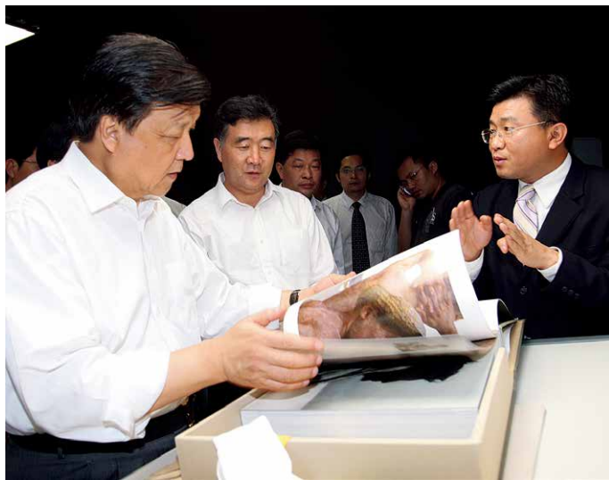
2008年，中共中央政治局常委刘云山莅临雅昌视察

2000年12月17日，我接到来自北京申奥委员会总部的电话，问雅昌是否有意承印“申奥报告”。我想了一分钟，就决定拿下这一任务。当时我一方面让副手带着我们获奖的印刷代表作飞往北京，去向申奥