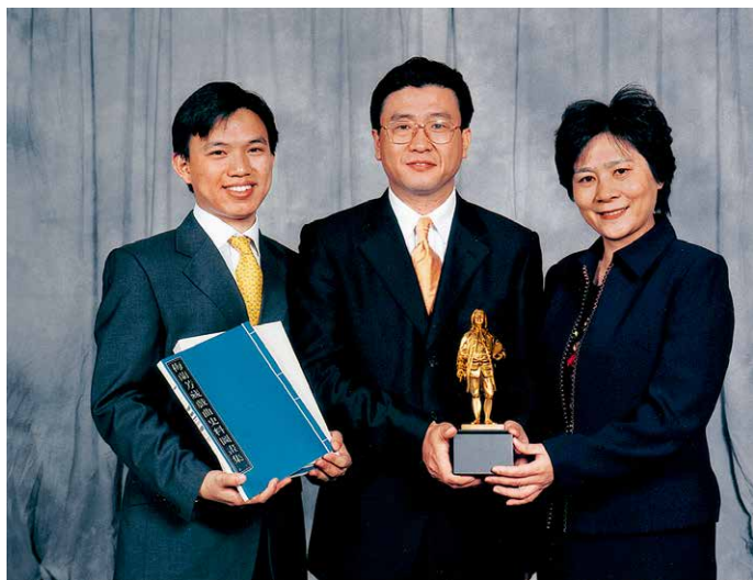
2003年，雅昌第一次获得印刷界的奥斯卡——班尼金奖