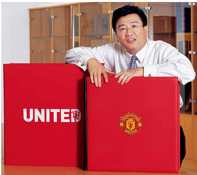
2006年，雅昌受到曼联俱乐部委托制作的编年史大书《曼联》

委展现我们的实力；另外一方面，我连夜与“申奥报告”监印工作组沟通，迅速编制出《印刷工艺规范书》和《岗位负责表》，18日一早就传真至奥申委总部，“申奥报告”的印刷任务最终如愿地花落雅昌。拿下“申奥报告”的印制只是一个开端，由于报告内容在前期翻译以及修改花了较多时间，留给雅昌的印刷时间实际上只有4天。那4天是我人生当中最紧张的时刻，基本上不敢合眼，所有的雅昌人都在拼命赶进度，我那时还特别担心诸如台风、停电以及自然灾害等不可控因素的发生。所幸一切顺利，中国在规定时间内上交了“申奥报告”。后来，国有大事，必有雅昌——国家有一些重大活动的报告印制，基本上都交给雅昌来做。直到现在，雅昌仍然是国家指定的唯一一家非国有企业的安全印制单位。