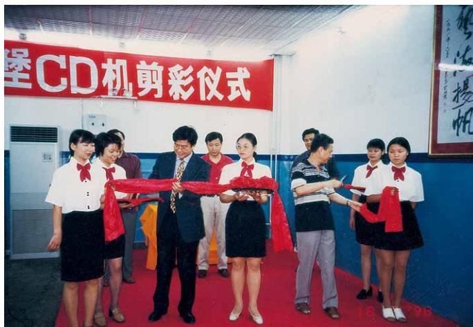
1998年海德堡CD机开机剪彩仪式

虽然我那时候对拍卖市场完全没有概念，不过我们深圳人一向敢想敢干，我大胆地把活儿接了下来。由于国内没有先例可循，连相关的研究书籍都没有，我们只能从全世界最顶尖的拍卖公司开始研究，同时跑了很多全球拍卖会在中国设立的预展，买回他们用过的图录，开始研究包括艺术分类、装帧、设计、文字编排以及图片处理等各个细节，想摸索规律。