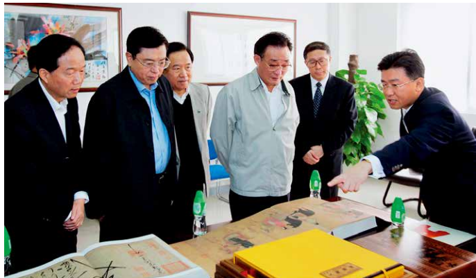
2005年，原中国中央政治局常委、全国人大常委会委员长吴邦国莅临雅昌视察

字号、间距等各方面的详细参数，这样标准化的做法，在加工行业中也是首开先河的。目前，我们服务的拍卖公司已超过600家，我们为每家定制的标准都不一样，因此你也找不到两家的拍卖图录是一样的。