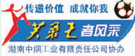
湖南中烟工业有限责任公司协办

三个点球罚丢后，胜利的天平就开始向南美人倾斜。结果，巴拉圭队五罚五中，成为本届世界杯首支点球制胜的球队。巴拉圭队也成为继乌拉圭队、阿根廷队和巴西队后，本届世界杯第4支晋级8强的南美球队。