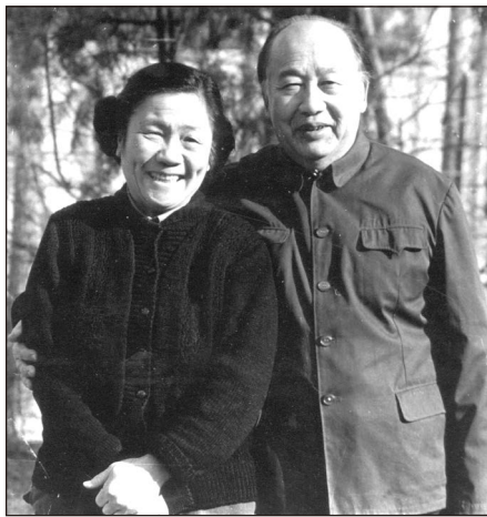
汪坦、马思琚夫妇，马思琚为著名音乐家