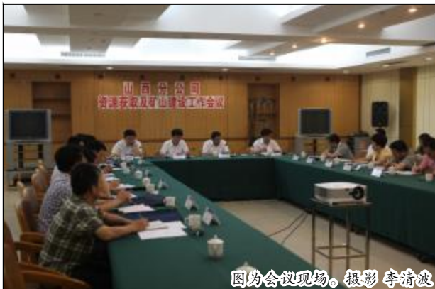
图为会议现场。

冷正旭指出,资源获取和矿山建设作为山西分公司业务板块的重要组成部分,是确保氧化铝生产的重要基础和前提,也是确保山西分公司保持持续运营30年,完