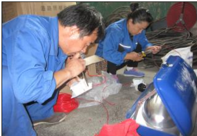
近日,生活服务中心维修二车间开展“百元个人、千元班组、万元车间”节约活动。各班组坚持“修旧利废,物尽其用”原则,发挥技术优势,充分挖掘内部潜力,加大废旧物资回收力度,提高旧品的修复使用率,减少新备件使用,上半年共节约材料费和人工费达 3 万余元。图为维修二车间员工对氧化铝厂前交换站故障风机进行修复改造,节省外购费用。

宣传思想政治工作,为企业经营管理提供思想支持和精神支撑的同时,在工作方法和管理手段上,也应该随着企业内外部环境的变化而不断更新和转变,更好地发挥思想政治工作的优势。笔者在长期工作实践中,得出了以下几点体会: