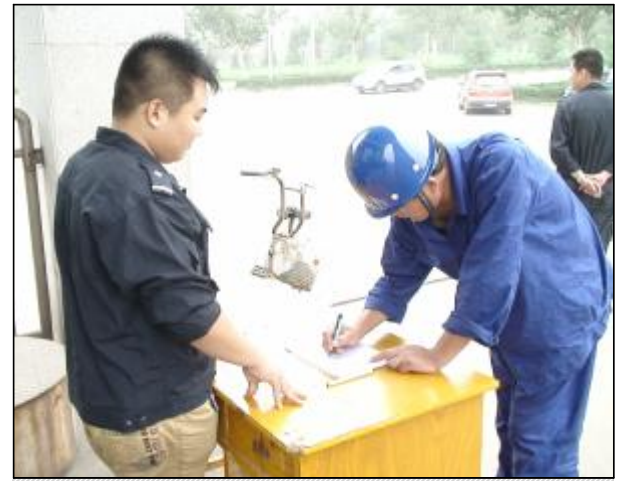
7月15日,武装保卫部联合山西分公司稽查组、各二级单位相关人员对进入氧化铝生产厂区的人员佩戴上岗证情况进行检查,无证人员一律不允许进入厂区,进一步规范氧化铝厂区人员、车辆和物资出入管理,加强企业资产安全保障力度。图为第二氧化铝厂门岗保安登记进入厂区的临时工作人员资料。

在活动开展过程中,车间坚持引导在前、督察在后、服务在前、考核在后,坚持每周一检查、每半月一跟踪、每月一点评、每月一考核,当月活动与当月绩效挂钩,日常活动、综合考评结果和员工评先评优、立功、年终绩效、晋升挂钩,确保培训取得积极效果。(郭娜 贺正民)