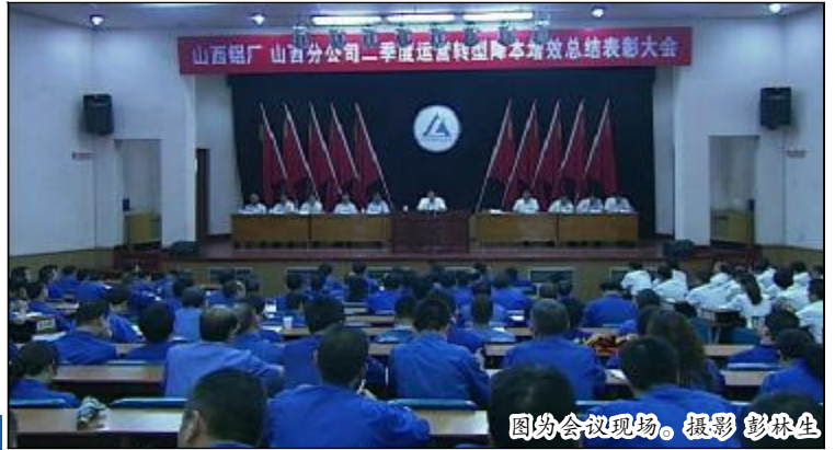
图为会议现场。