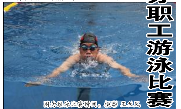
图为蛙泳比赛瞬间。

本次游泳比赛采用预赛赛制,既有蛙泳、仰泳、自由泳等传统项目,又有贴合企业实际的接力比赛。参赛运动员在水中你追我赶、奋勇争先,吸引了众多员工家属的关注。经过激烈角逐,水电分厂、第二氧化铝厂、生活服务中心代表队分获团体比赛前三名。(王兰凤 嘉焯娟)