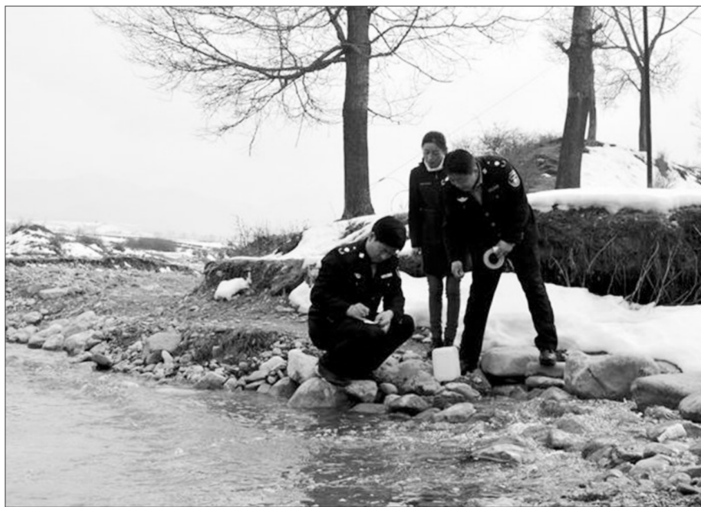
作为渭河发源地,甘肃省渭源县日前组织县环保局、水务局等单位的工作人员深入各乡镇和水源地保护点检测水质,确保百姓喝上放心水。图为县环保局技术人员在峡口水库水源地取水样。

济南市环保局还将以全市行政审批服务平台为支撑,不断提升网办深度,秉承“以人为本,服务为本,把简单留给群众,把复杂留给系统”的理念,围绕“让数据多跑路,让群众少跑腿”的工作目标,争取让有条件全程网办的事项年内全部实现网上办理。