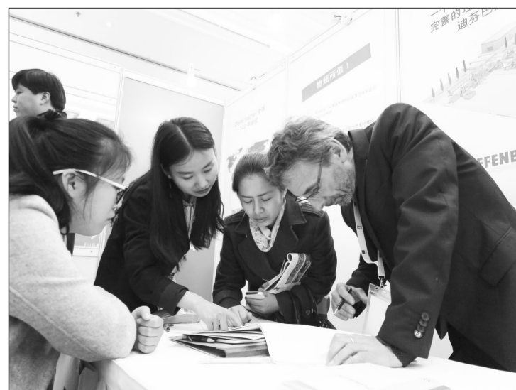
欧企中国门户网站日前在北京市启动,来自欧盟清洁技术领域的40家企业与中国同行业企业建立互利共赢的合作关系,共建新型清洁技术伙伴关系。

上饶市环保局鼓励机动车安全技术检验机构、机动车排气污染物检验机构以及机动车综合性能检验机构合署办公。同时,加强监督管理,严厉查处排放检验机构违法违规行为,采取“双随机、一公开”(随机抽取检查对象、随机选派执法检查人员,及时公开查处结果)方式,对排放检验机构进行抽检;对抽检不合格的,环保部门暂停联网,限期整改;对其他违法违规行为依法严肃处理,进一步规范机动车排放检验行为。 余建峰