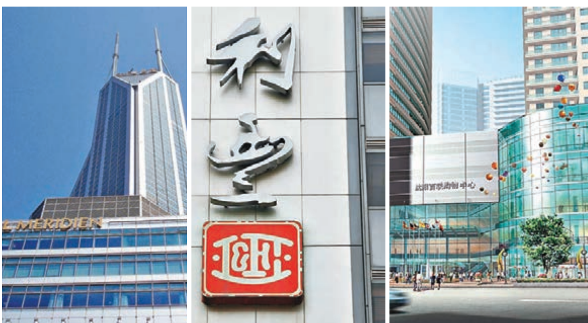
百聯世貿國際廣場。資料圖片 利豐 資料圖片 瀋陽百聯購物中心。資料圖片

公告指出，合資公司將通過自主開發、取得授權或收購的方式推進品牌的開發；尋找適合的外部品牌，開展總代理/總經銷業務；通過三方業務網絡來確定