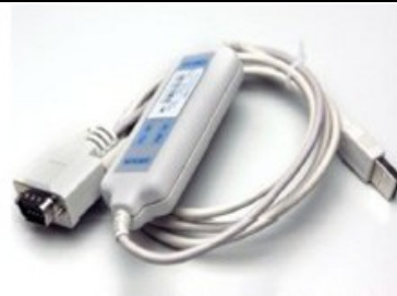
USB 配通讯软件 M133 通讯线