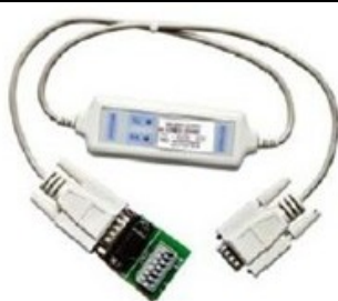
RS485 配通讯软件 M132 通讯线