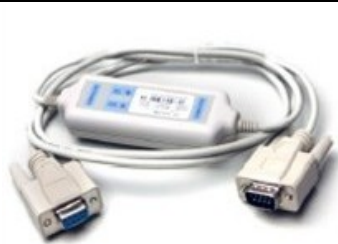
RS232 配通讯软件 M131 通讯线