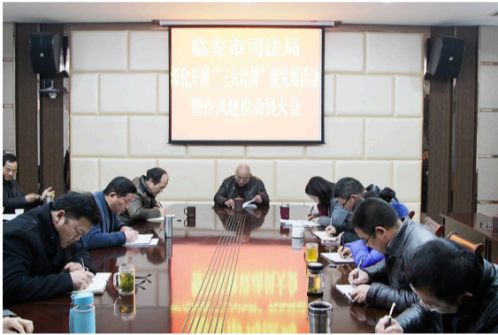
市司法局召开专题会议,部署落实“三大比拼”工作