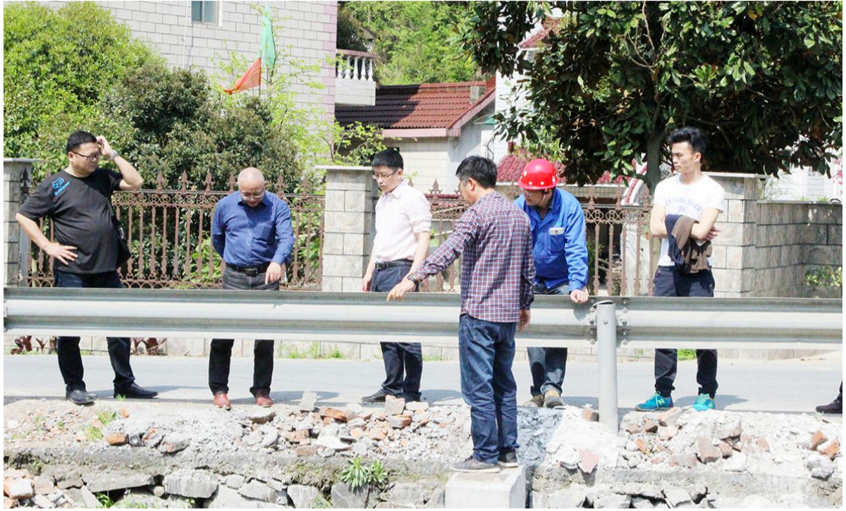
法律服务小分队实地走访企业施工现场,排查化解隐患问题