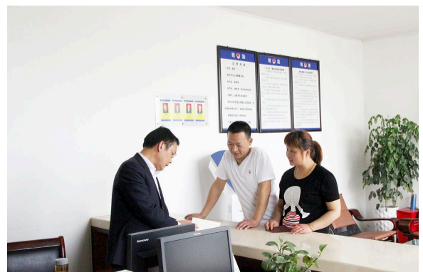
市法律援助中心工作人员接待来访的企业人员