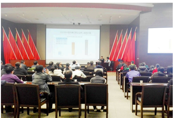
律师为青山湖科技城企业讲授法律课

针对当下跨境电商的热点,分别从各自专业角度为参会企业代表讲授了《知识产权边境保护制度》和《跨境电商企业八大法律风险提示》的课程。同时,浙江满江红律师事务所与市商务局协作成立了跨境电商园法律服务基地,专门组建法律服务团队,为跨境电商提供法律风险防范及实务处理解决方案。 记者 朱陈伟 通讯员 蒋琳