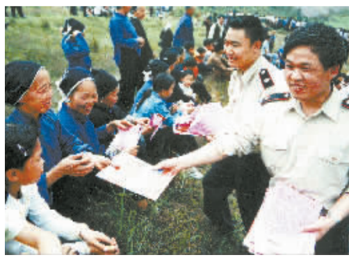
4月17日,在通道侗族自治县牙屯堡镇举办的大颧山歌会上,县国税局干部组织侗族民间歌手以税法宣传资料为歌词,编唱税法山歌,给歌会增添了乐趣,当天还散发税法宣传资料2万份。

目前,人工饲养的大颧市场价达每公斤1500元,由于解决了大颧养殖率低这一制约产业化发展的瓶颈,花垣已将大颧产业化项目列入“十一五”规划,采取“公司+农户”的模式,实施“千户大颧养殖扶贫工程”,建立大颧生态保护区和大颧旅游观光带,加工生产高附加值的大颧保健酒、大颧保健饮料,提取药用金属硫蛋白等。