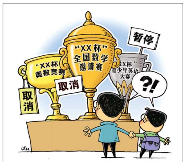
“叫停” 新华社发 徐骏 作

实际上,目前,在一些地方,各类“杯赛”作为小升初敲门砖的作用正在下降。武汉一所重点初中教务主任说,武汉市有10多个小学奥数竞赛,“有的比赛就是为了商业利益,越来越缺乏公信力,竞赛结果只能作为一种参考。”