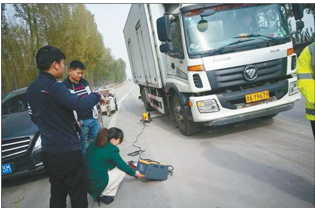
近日,河北省邯郸市环保局鸡泽县分局购置便携式尾气检测仪,联合交警部门每天对过往重型机动车辆进行检测,严格控制尾气排放污染。图为鸡泽县空气质量监测人员在鸡泽高速路口对过往车辆进行尾气检测。

依照《水污染防治行动计划》相关的规定,省环保厅及各市、县环境保护局从2018年1月1日起,对上述未完成污水处理设施建设和未安装自动在线监控装置的工业聚集区,暂停审批其增加水污染物排放的建设项目。各工业聚集区在整改完成后,由市级环境保护部门向省环境保护厅报告,核实后予以解除。