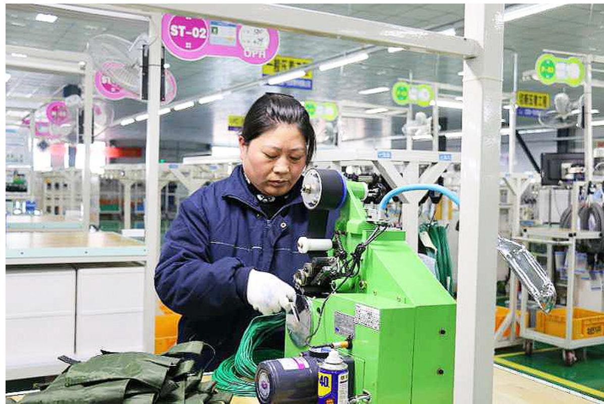
位于合德镇高科技产业园内的江苏东信电子有限公司是东风悦达起亚集团的专业零部件配套厂家,主要生产和销售汽车线束及车辆零部件。年初以来,该公司狠抓科技创新,积极开发悦达起亚新型车型配套产品,截至目前已完成开票销售3000余万元。图为工人正在赶制一批订单。

今年,该公司联合胜达集团双灯纸业、中国浩然再循环纸业有限公司组建江苏扬子胜达科技发展有限公司,计划投资4.556亿元,共新建、改造三条造纸生产线,以开发新用户。“相信我们的生产能力将进一步提升,供气量、发电量将达到新高。”公司生产负责人对未来发展前景充满信心。