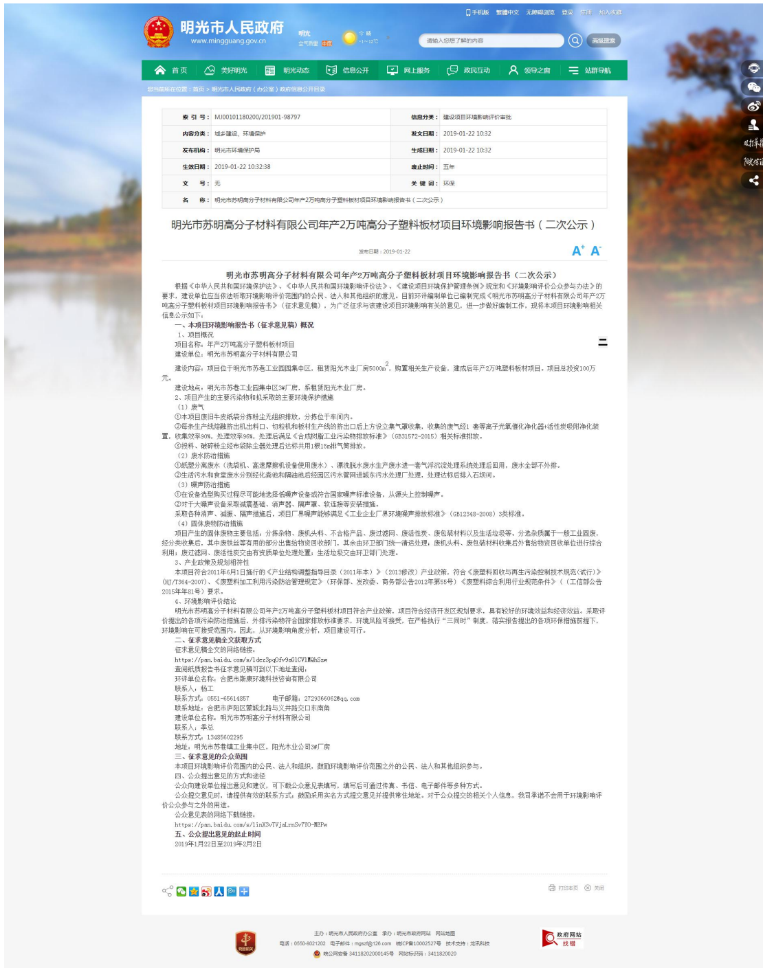
图 2 征求意见稿公示网络截图