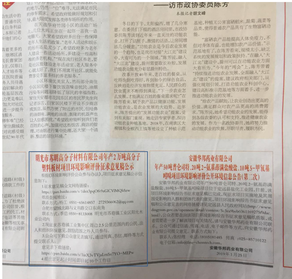
图 4 报纸第二次公示截图