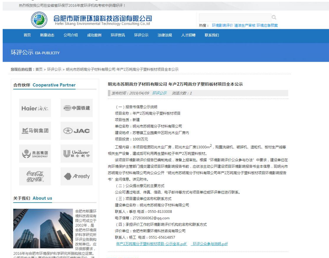
图 8 报批前网络公示截图