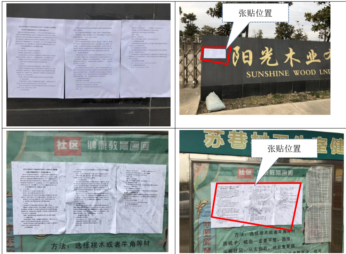
图 5 现场张贴公示