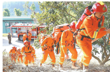
珠海森林防火专业队伍近期组织应急演练,防范山火。