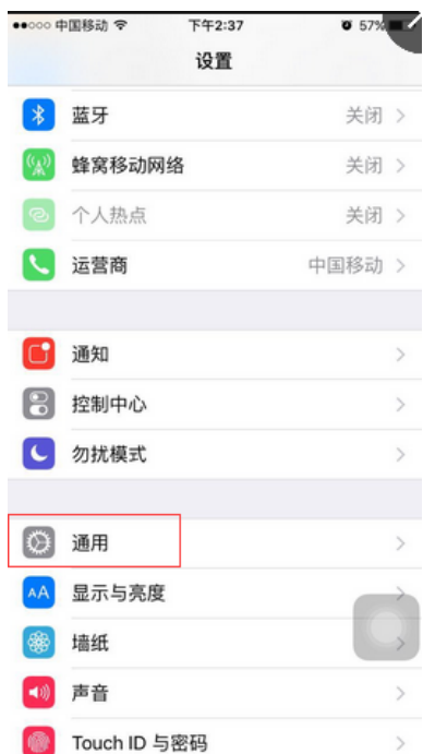
1、设置 — 通用