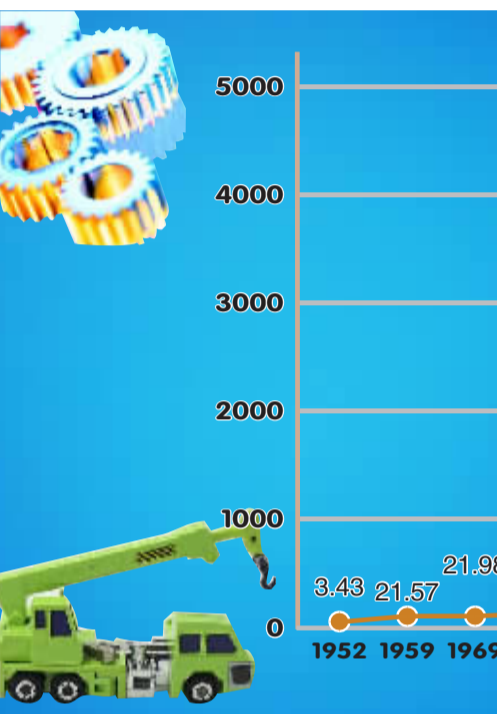
新中国成立60周年来湖南地区第三产业产值增长示意图

改革开放以来，我省工业发展走上快车道，逐步形成了较为完整的工业体系，拥有了装备制造、钢铁有色、石油化工、烟草制造、新材料、食品加工、生物医药、造纸工业、建筑材料、电子信息等十大优势产业集群和77个各具特色的工业园区。2008年，湖南全部工业产值4933.08亿元，工业增加值4280亿元，是1952年的605.3倍，1953—2008年，年均增长12.1%，规模工业增加值由1978年的41.94亿元增加到2008年的3570.85亿元。