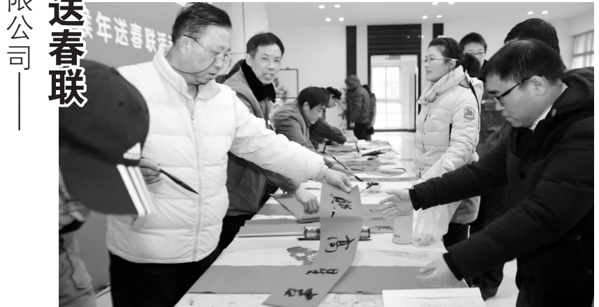
图为企业文化家为职工写春联