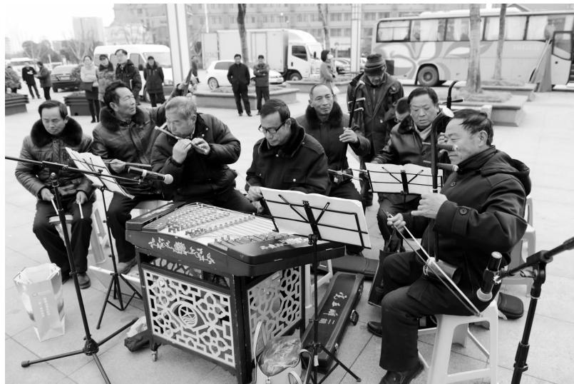
图为宿迁市宿城区属园乡企业演员在演奏淮红戏《打情杆》。

据悉,该公司工会新春送春联活动已持续开展多年,通过充分发挥书法协会资源优势,以送春联这一员工群众喜闻乐见的形式,在服务广大员工、彰显企业文化的同时,进一步增进了公司与员工的情感,为公司更好地凝心聚力开展好2016年各项工作起到了积极作用。 韩轲