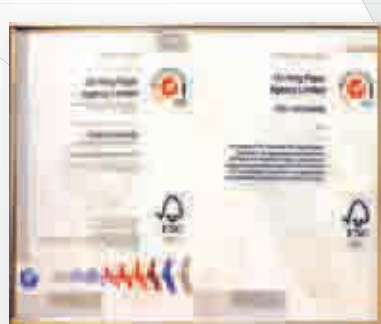
■ 安興是首家批發 FSC 辦公室用紙的紙商。

安興很早就將具有國際環保認證的 FSC 紙張引入市場，也是首家批發 FSC 辦公室用紙的紙商，來自澳洲、歐洲、南非、巴西、印尼及大陸等地。此外，安興也代理含 100% 再造成分、從印尼進口的再生紙。由於以上產品均附有國際認可的標籤，因此安興無需多費唇舌向客戶解釋。