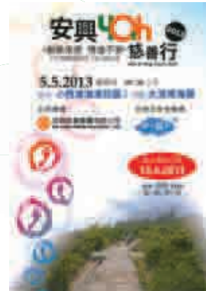
■ 安興慶祝40周年仍不忘做善事，「安興四十慈善行」是慶祝活動之一。