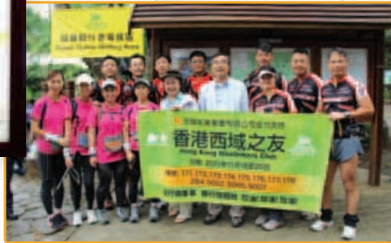
■ 為善不甘後人，安興員工一同參與毅行者。