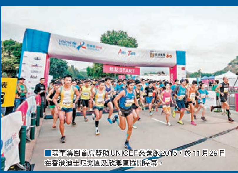
嘉華集團首席贊助UNICEF慈善跑2015，於11月29日在香港迪士尼樂園及欣澳區拉開序幕。

嘉華集團適逢60周年，秉持「傳承關愛，穩創未來」及長期支持慈善事業和社會責任的宗旨，嘉華集團擔任聯合國兒童基金會慈善跑（UNICEF Charity Run）2015首席贊助，捐款200萬港元全力支持UNICEF的「攜手為兒童，攜手抗愛滋」全球運動，為「零愛滋世代」（AIDS to ZERO）的目標獻一分力。