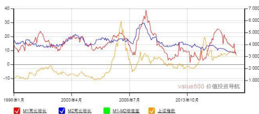
M1-M2 增速差与上证综合指数走势图

4. 大气污染 | 为期一年的京津冀及周边地区大气污染防治强化督查已经结束。针对近期强化督查发现的问题，生态环境部已向 20 多个城市发出督办函，要求各地及时完成问题整改。