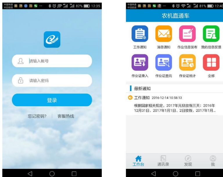
（图 2-1）手机客户端工作台首页

打开农机直通车政务版客户端，录入正确的手机号码和密码，进入到手机客户端的【工作台】首页，如（图 2-1）所示。