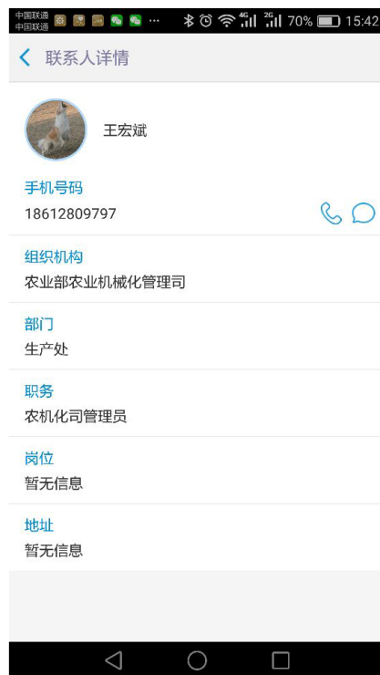
（图 4-2） 通讯录详情

在（图 4-1）中，点击【组织机构】或【部门】可以快速筛选职员，点击职员姓名可以查看职员详情，并可以进行拨打电话和发送短信操作，如图（4-2）所示。