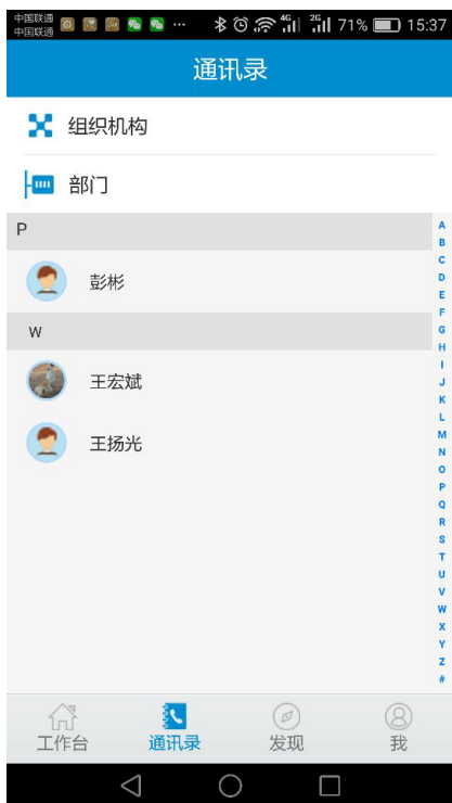
（图 4-1） 通讯录操作界面

点击页面下端的【通讯录】按钮，可以查看同级机构的通讯录，进入（图 4-1）所示的通讯录操作界面。