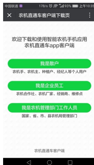
（图 1-2） 农机直通车手机客户端下载页面