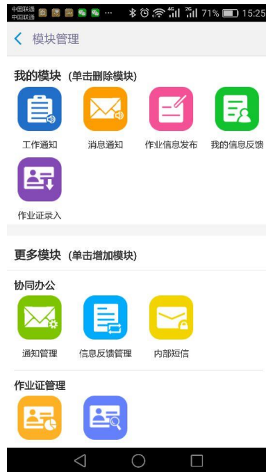
（图 3-1） 工作台功能定制操作界面

在工作台页面中，点击【全部】图标，进入（图 3-1）所示的工作台个性化定制操作界面。