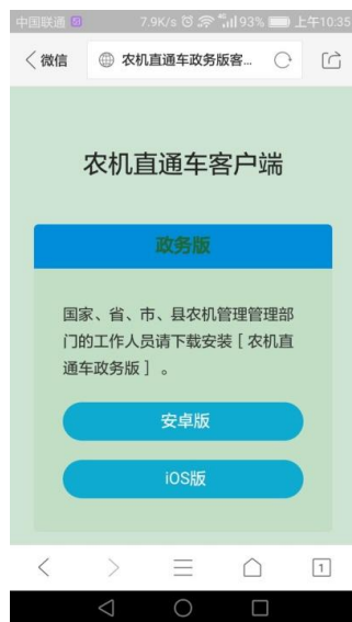
（图 1-3）政务版手机客户端下载页面

在（图 1-2）中，点击 我是农机管理部门工作人员 跳转至（图 1-3）所示的政务版客户端下载界面。