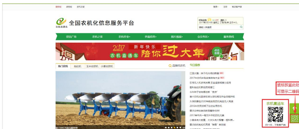
（图 1-4）农机直通车门户网站

通过手机的扫一扫功能，扫描农机直通车网站： http://www.njztc.com 主页右侧二维码，如（图 1-4）所示：