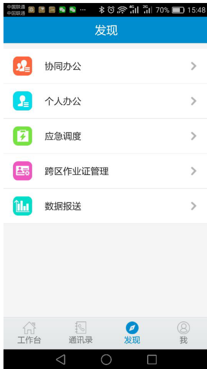
（图 5-1） 功能模块操作界面

点击页面下端的【发现】按钮，可以查看系统授权的全部功能，进入（图 5-1）所示的功能操作界面。