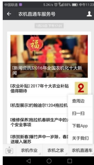
（图 1-1） 农机直通车微信公众号

利用微信关注【农机直通车服务号】，在【农机直通车服务号】中，点击【农机直通车】页签，如（图 3-1 所示）。