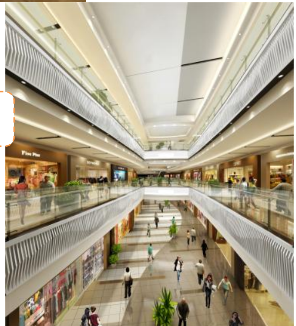
象征着海岸线的 “中庭 (Main mall)”