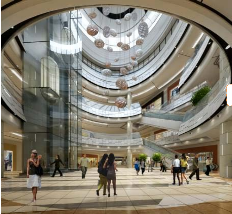
以海浪为形象设计的 “迎宾广场 (Welcome Court)”

本购物中心周边是完善的美丽海岸和公园，该地区是游览胜地，夏季来临时有很多游客前来游玩。本购物中心意识到要灵活发挥地域优势，以“耳目一新的海岸线”为关键词进行了设计。在购物中心内可以将“沙滩”、“港湾”、“波浪”、“岩石”等关于海岸构成元素转化为建筑要素，并将其组合在一起，让客人感受到“烟台”，同时也提供了可乐享其中的非日常生活的空间。