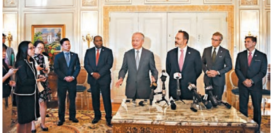
中國駐美大使崔天凱(右四)於當地時間8月13日在肯塔基州首府法蘭克福出席活動。中新社

香港文匯報訊 據新華社報道，中國駐美國大使崔天凱於當地時間13日在美國肯塔基州會見州長馬特·貝文時表示，中國不尋求「一枝獨秀」的發展，將尋求同包括美國在內的其他國家開展合作。