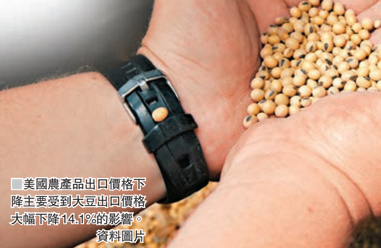
美國農產品出口價格下降主要受到大豆出口價格大幅下降14.1%的影響。資料圖片