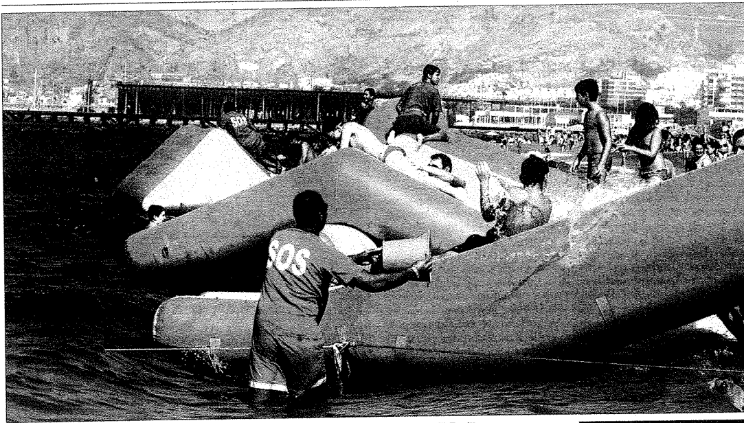
Cientos de menores acudieron a las atracciones playeras que ayer se pudieron disfrutar en El Zapillo.