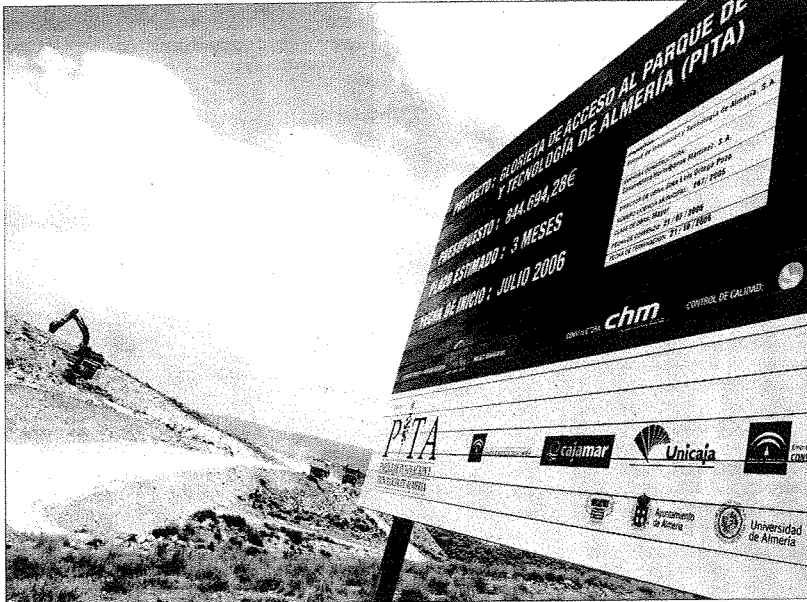
■ Lugar sobre el que se construirá el Parque de Innovación y Tecnología de Almería, el PITA.

El Parque se ha convertido, desde su gestación, en escenario en el que se jugarán los mayores retos para el desarrollo tecnológico almeriense. Además de conseguir la aprobación de un Plan Parcial para su implantación en la capital, el PITA se ha hermanado con la Universidad de Almería. La institución educativa ha cedido terrenos para la construcción de la sede del PITA en el campus. Ese hecho confiere al Parque de Innovación y Tecnología de Almería la característica única