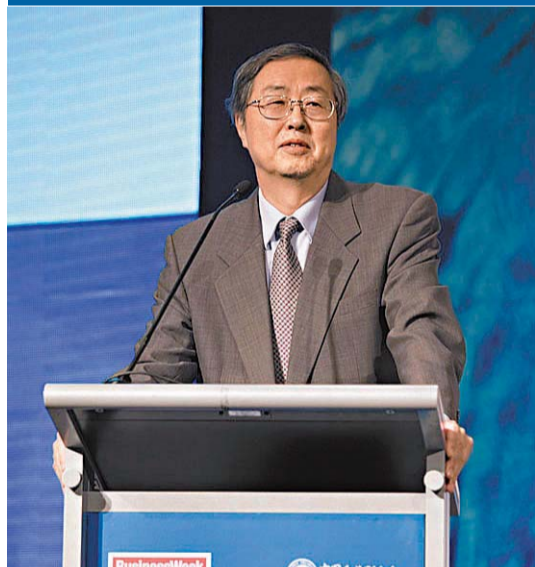
周小川昨日出席一個金融論壇時指，中國一些傳統製造業已出現「產能過剩」現象。

【本報訊】綜合媒體20日報道：中國人民銀行行長周小川20日警告，中國在一些傳統製造業和基礎設施建設領域已出現「產能過剩」現象，中國必須保持警惕和戒備，防止新一波金融危機的爆發，因為金融危機具周期性且無可避免。