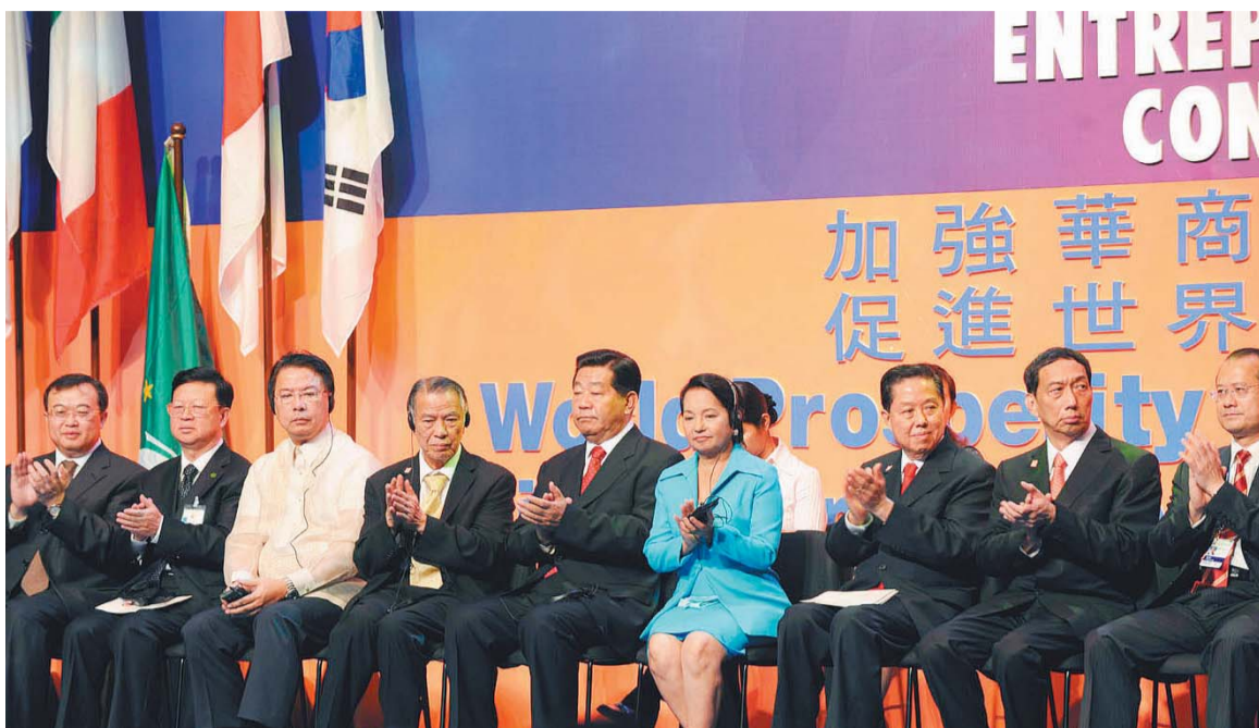
第10屆世界華商大會昨在菲律賓馬尼拉開幕。菲律賓總統阿羅約、中國全國政協主席賈慶林等出席大會開幕儀式。

今屆大會主席為菲律賓著名僑商領袖陳永裁。會上，菲華商聯總會理事長、大會副主席黃禎潭，香港中華總商會會長蔡冠深，大會組委會主席、菲華商聯總會名譽理事長蔡聰妙等致辭。出席嘉賓有國僑辦主任李海峰，大會還邀得全國政協副主席、工商聯主席黃孟復等中國領導人等多個國家及地區的要