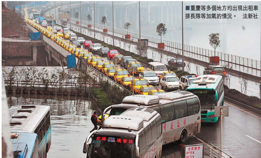
重慶等多個地方均出現出租車排長隊等加氣的情況。

【本報訊】隨著中國大陸各地先後出現冰雪災害極端事件，天然氣驟然供不應求，不僅僅影響到民眾供暖，工業企業的生產經營也受到波及。除北方城市哈爾濱外，其他南方城市如武漢、江蘇無錫、杭州等地目前均出現氣源緊張的情況。專家指，氣源緊張對經濟的影響暫時尚不太大，有指關鍵取決於未來一段時間的氣象條件。